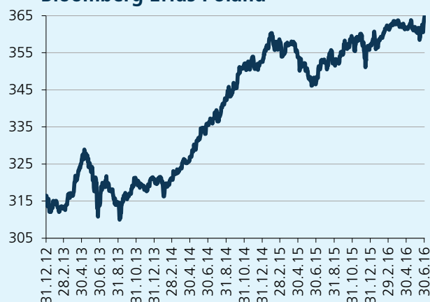
Bloomberg Effas Poland

Polska krzywa w czerwcu w przeciwieństwie do np Czech poruszała się znacznie mocniej. Doszło do obniżenia nachylenia, rentowność na krótkim końcu pozostała bez zmian, głównie dlatego iż perspektywy polityki pieniężnej nie zostały zmienione (dwuletni letni zysk 1,7%), natomiast na długim końcu, polskie obligacje naśladowały swoje niemieckie odpowiedniki i spadły o 20 p.b. (dziesięcioletnie pod 3 %).