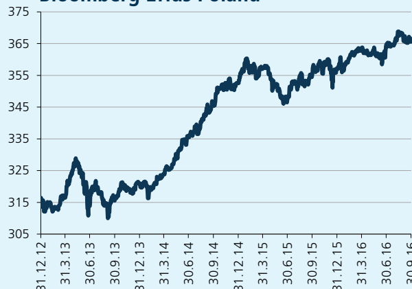
Bloomberg Effas Poland

Polskim obligacjom nie wiodło się najlepiej, krzywa rentowności we wrześniu nieznacznie zwiększyła nachylenie. Przychody w segmencie obligacji średnio- i długoterminowych wzrosła o 10 do 15 pb. Twarde dane makroekonomiczne (zmniejszając szanse możliwej obniżki stóp procentowych), być może obawy z luźniejszej dyscypliny fiskalnej w przyszłym roku był jednym z decydujących powodów tego rozwoju.